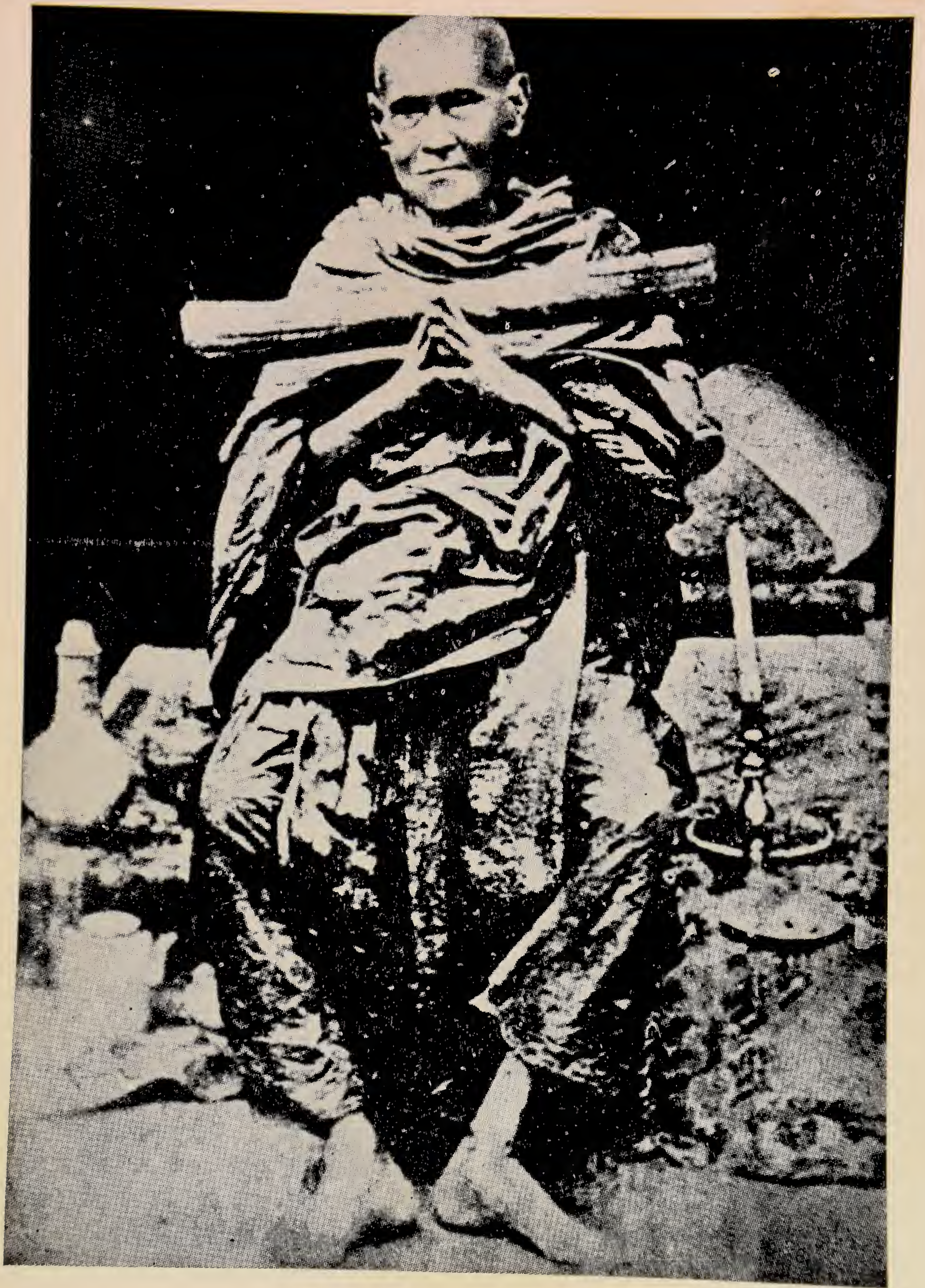
สมเด็จพะพุมมาจารย์ (โต)