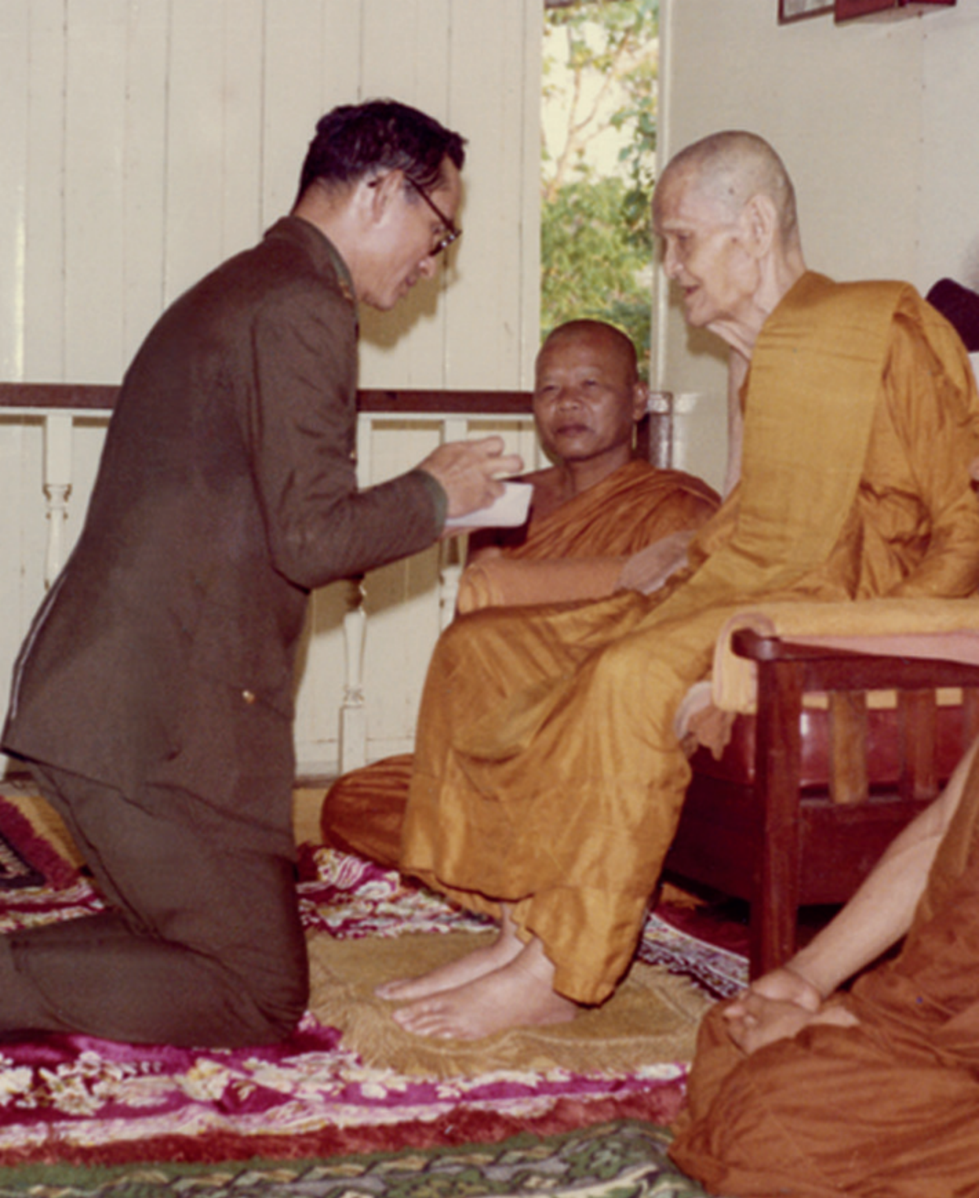
พระอนาโย หลวงปู่ขาว พระบาทสมเด็จพระปรมินทรมหาภูมิพลอดุลยเดช รัชกาลที่ ๙