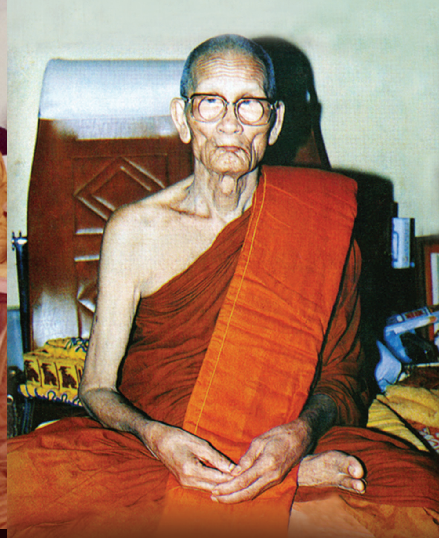
พระอภิญโญ หลวงปู่สาม วัดป่าไทรวิเวก อำเภอเมือง จังหวัดสุรินทร์